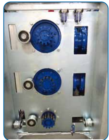
Grupo motor Drive unit