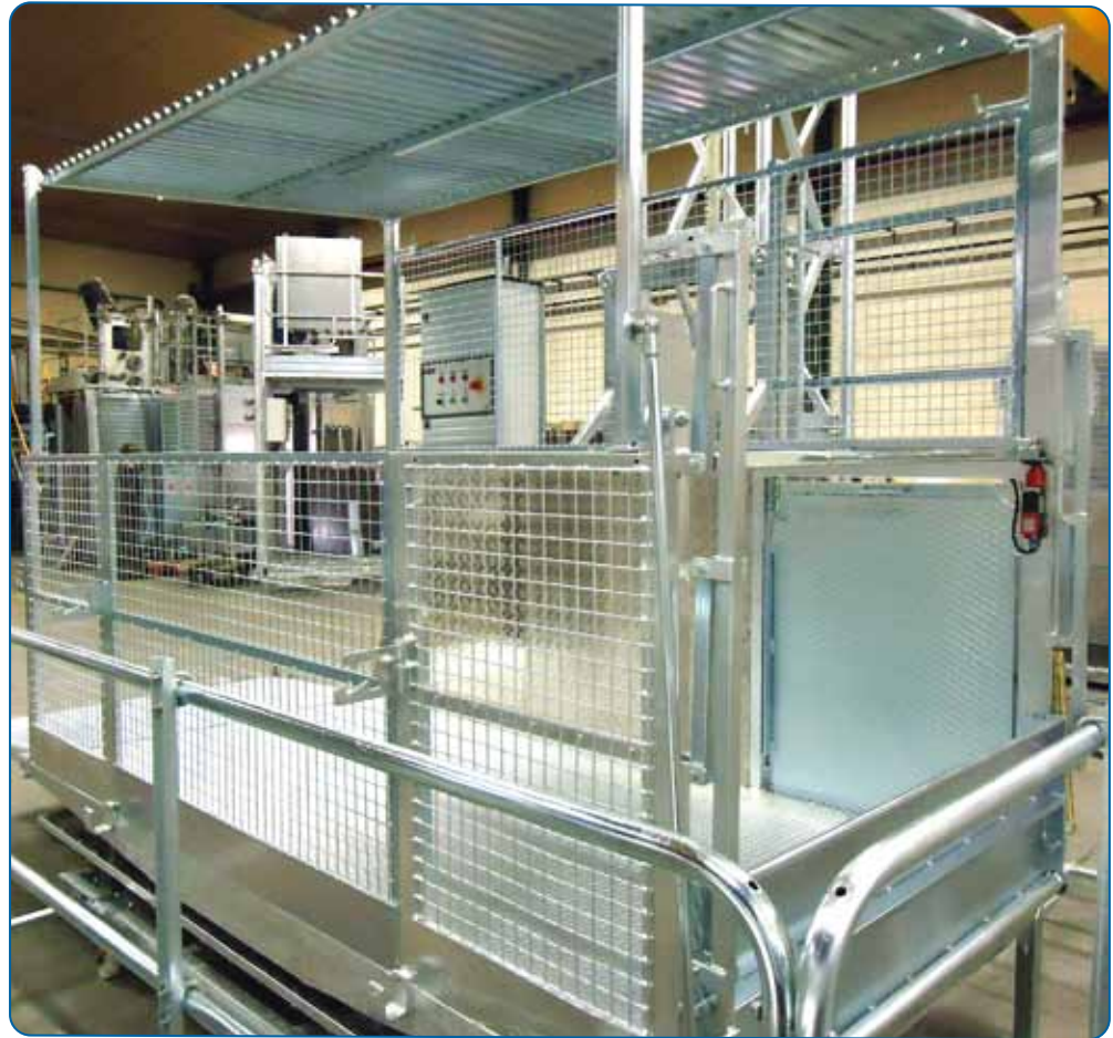
Plataforma y su protección en base Platform and its protection in the base

All the TORGAR Transport Platforms are designed and manufactured complying with the European Standard 2006/42/CE (References EN-12158, EN-12159 and CEN/TC 10/SC 1/WG4-N130)