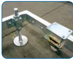
Detalle de la base Base frame detail