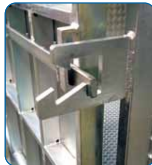
Cierre de doble posición en rampa External control Panel