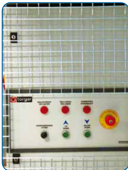
Cuadro de control en plataforma Control panel in Platform