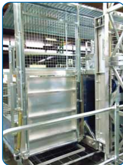
Rampa de montaje para tramos Assembling ramp for mast sections