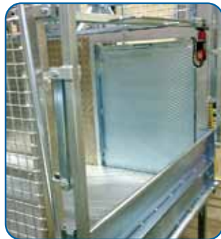
Rampa de acceso a planta Access floor ramp