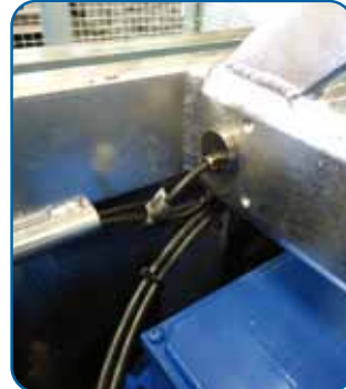
Célula de pesaje Load cell