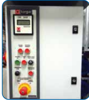
Cuadro de control en base Control panel in the base